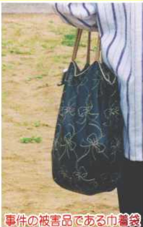
事件の被害品である巾着袋 (黒地に金色のリボン模様入り)