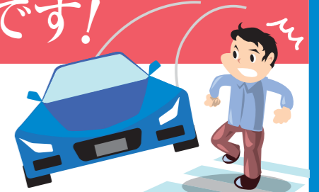
宮城県内の歩行者事故の発生割合