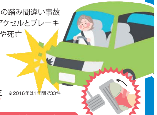
ブレーキ・アクセルの踏み間違いによる死亡事故

最近、全国において、高齢運転者によるアクセルとブレーキの踏み間違い事故が急増しています。今年に入り宮城県内でも、高齢運転者がアクセルとブレーキを踏み間違い、店舗などに突っ込む事故が多発し、重傷事故や死亡事故に至った事故も発生しています。