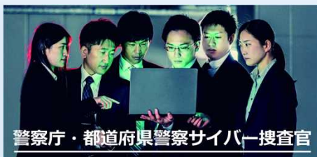
警察庁・都道府県警察サイバー捜査官

全国の約3,600人がサイバー空間の脅威への対処に専従 全国で『サイバー犯罪捜査官』が活躍中