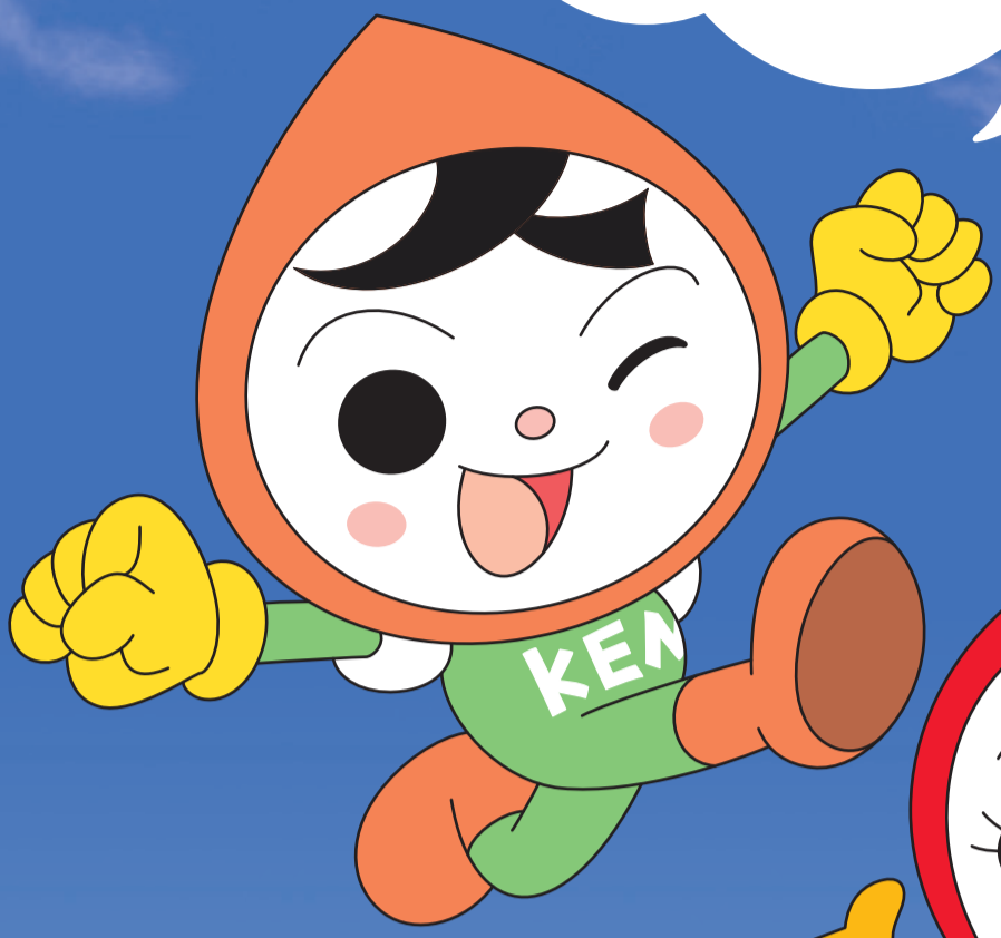
人権イメージキャラクター 人KENまもる君